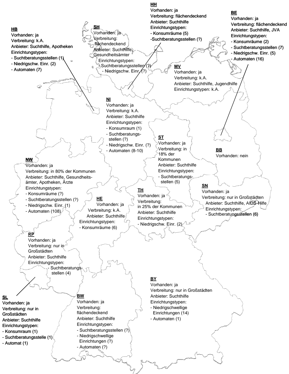
Abbildung 2: Verfügbarkeit von Maßnahmen zur Spritzenvergabe (kostenlose Abgabe, Tausch und Verkauf) aus Sicht der befragten Länderexperten